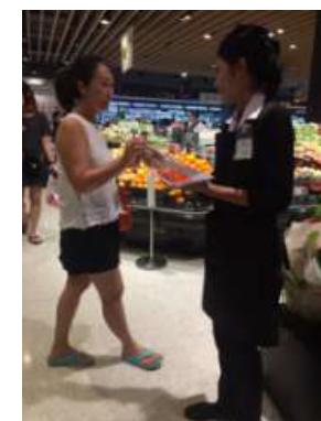
いちごの試食販売