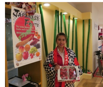
販促グッズの活用