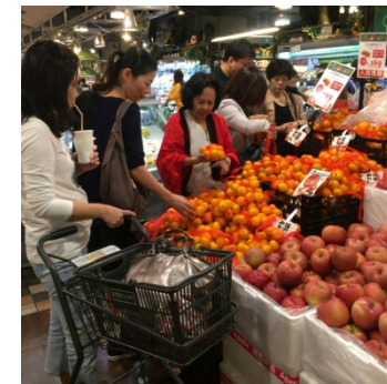
農産物の展示風景