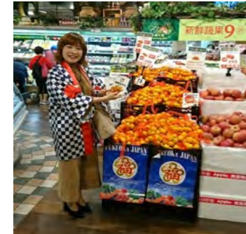
販促グッズの活用

台湾の残留農薬基準に対応する防除暦作成の取組みにより生産された「いちご」「みかん」を台湾に輸出。販売促進フェアの実施により、福岡県産いちご・みかんをPRすることができ、認知度向上につながった。