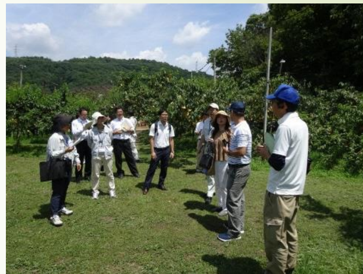
ほ場における査察状況