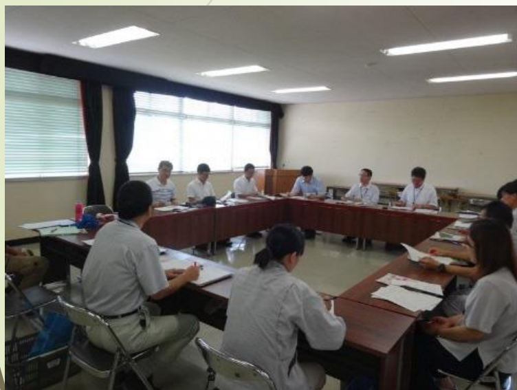
全体の打ち合わせ状況