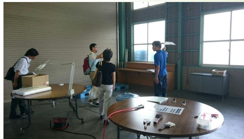
選果施設における査察状況