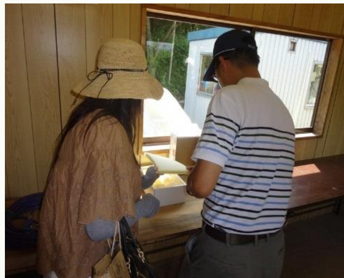
出荷形態についての説明状況