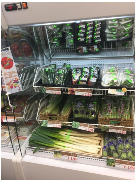
今回は12月開催ということもあり 鍋にあう野菜を販売