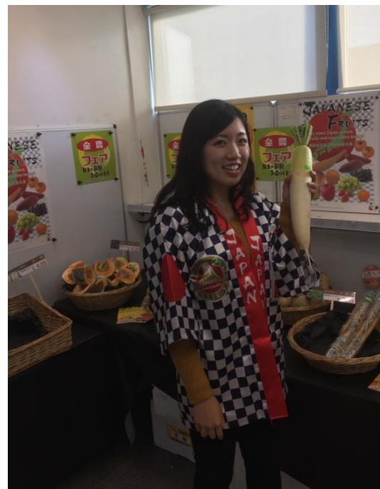
大根等の日本産の高品質さが 際立つ品目をセレクト