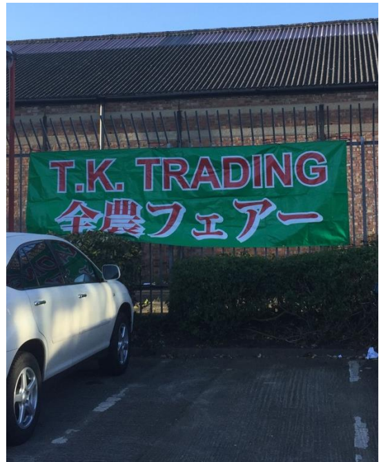
日本人駐在員が多い地区であるため 日本語のバナーでもPR