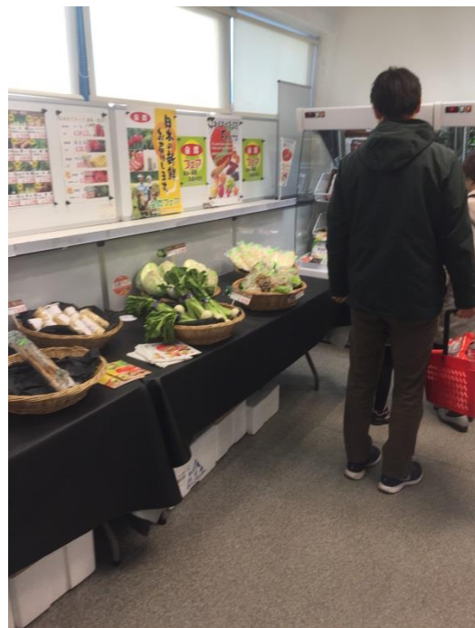
鍋にあう野菜は 日本人駐在員家族から大人気