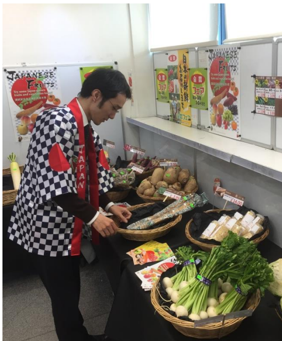
Japanese Fruitsシールやポスターで オールジャパンをアピール