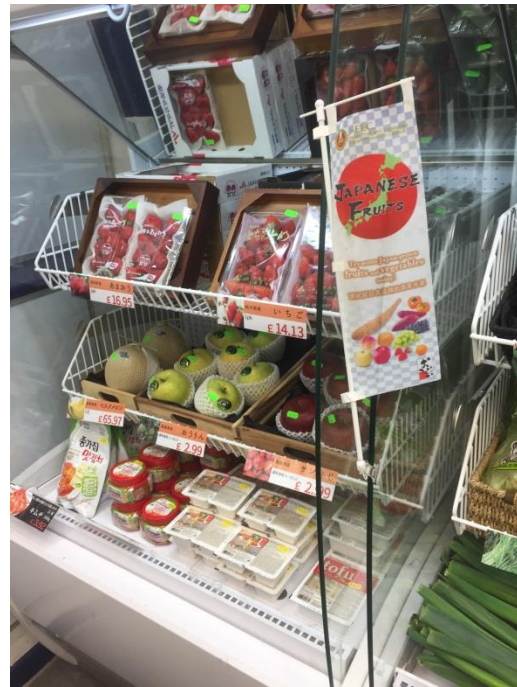
果物等の高級品を中心として 冷蔵棚コーナー