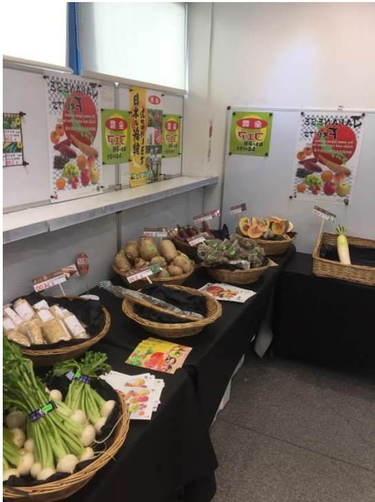
葉物・根菜類を中心とした 常温棚コーナー