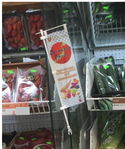
「イギリス・ロンドン TKトレーディング JA全農フェア」

対象国・地域 : イギリス・ロンドン 実施期間 : 平成29年 12月9日～12月10日 (フェアに係る出張 : 平成29年 12月8日～12月12日)