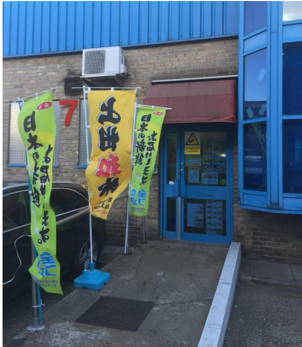
会場のTKトレーディング入口は 全農フェアのノボリでPR